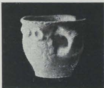
Fig. 146.—Vas de Beranuy, de la col·lecció Sala, de Vich

forma triangular, secció oval allargada i dimensions més petites, generalment, que les anteriors. Tipus molt abundant.—3. Destrals de pedra de diferents menes, generalment polides, de forma trapezoidal, aplanades i de secció oval. Les dimensions oscil·len entre 10 i 15 cm. Tipus molt abundant. (Núm. 2 de la taula).—4. Una destal de tall oblic, de fibrolita, trapezoidal, de secció ovalada, procedent de Sant Pubí de Veciana (Barcelona), amb una regata produïda per frotació (1), 12 cm. de llarg. Pes, 750 grs. (Núm. 3 de la taula).—5. Destraletes de fibrolita, totes molt ben polides, de forma trapezoidal i secció rectangular, amb un sol tall, i que oscil·len